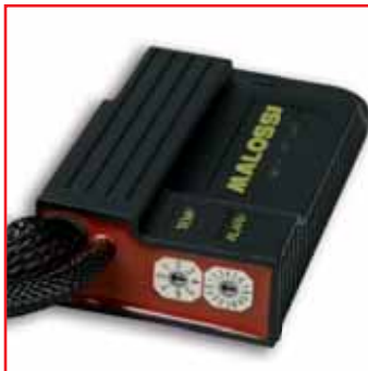
Trimmer TEMP - TEMP Trimmer - Trimmer TEMP

ATTENTION : il est recommandé de ne pas procéder aux réglages lorsque le véhicule est en mouvement.